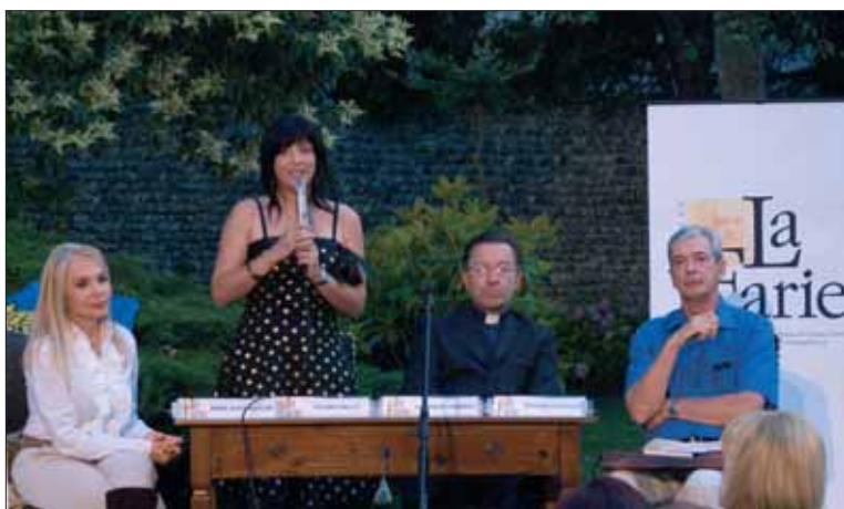
Lestizza: "Rievocazione storica della nascita del Friuli, 930 anni di patria". Le scene sono state accompagnate dalla musica di Ottoni e Coro del Friuli Venezia Giulia Gospel Choir.

Alla presentazione del libro ha fatto seguito una rappresentazione teatrale della Filogrammatica di Santa Maria di